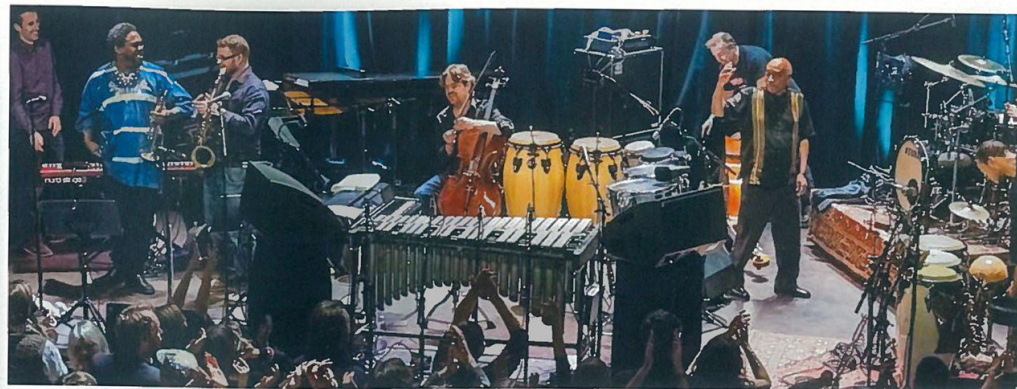
Ethio-jazz-gudfaren Mulatu Astatke spilte på Cosmopolite under jubileumsfestivalen. Dette bildet er tatt da han besøkte Cosmopolite i fjor.

«Når han får oppmerksomhet, skifter han tema, snakker om andre, om klubben eller om sine barn, eller vender lyskasteren en annen vei. Han liker